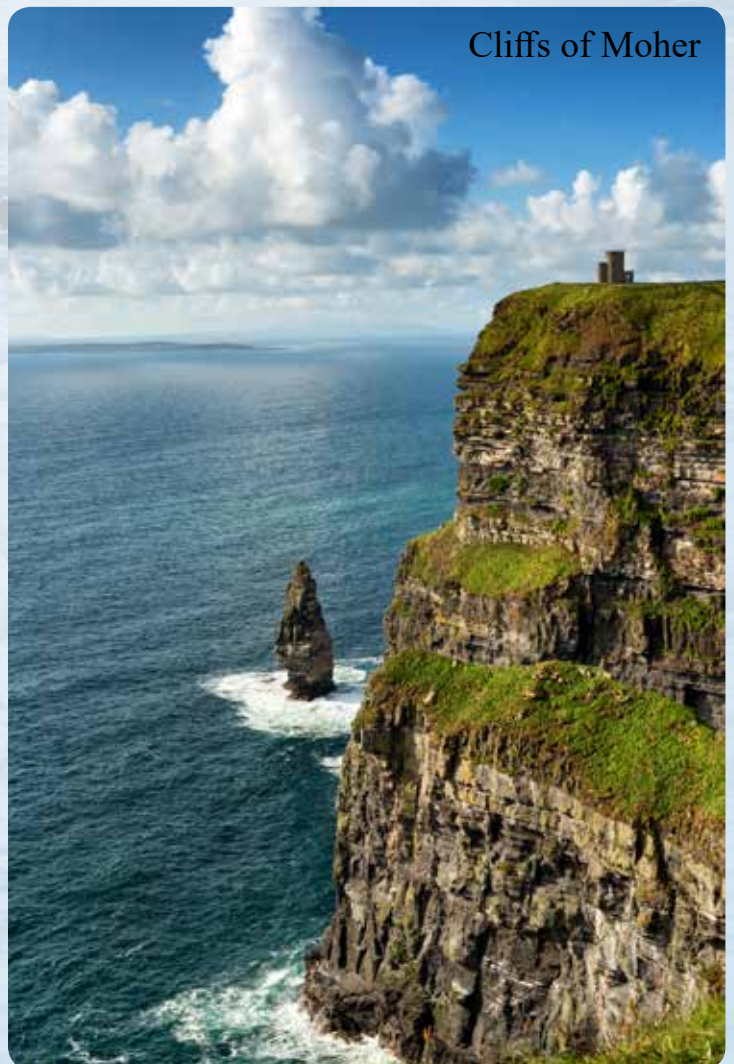
Cliffs of Moher