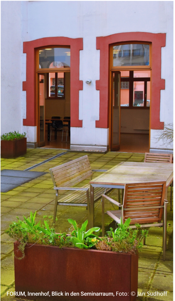
FORUM, Innenhof, Blick in den Seminarraum, Foto: © Jan Sudhoff