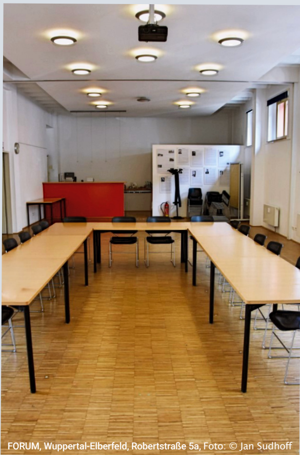
FORUM, Wuppertal-Elberfeld, Robertstraße 5a, Foto: © Jan Sudhoff